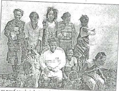
Les neuf cambrioleuses ont sévi dans différents quartiers de Libreville avant d'être neutralisées par la PJ.