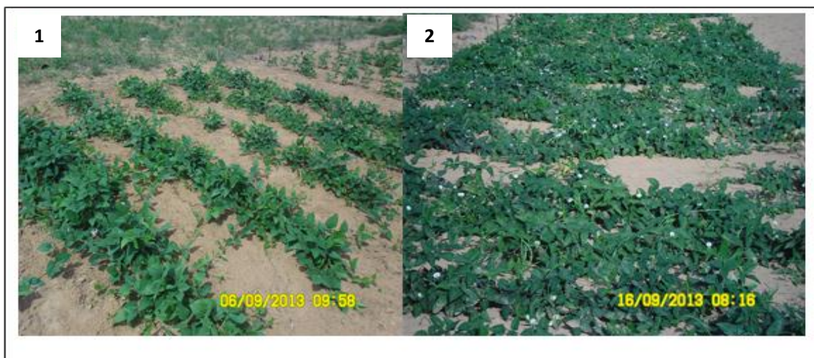
Figure 3: Essais production(1) et caractérisation(2) de niébé fourrager à la station agronomique de l'INRAN

Pour l'analyse de la valeur alimentaire des fourrages les matériels suivants ont été utilisés :