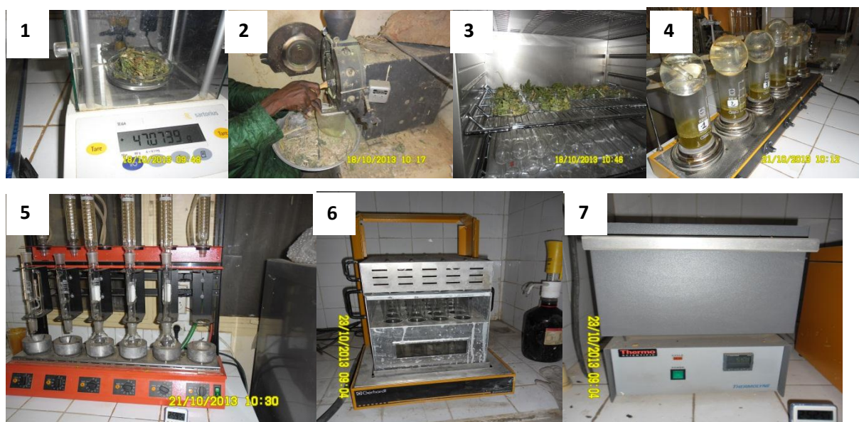
Figure 4: Matériel de laboratoire

(1) Balance numérique de précision et peson ;(2) Broyeur ; (3) Etuve ; (4) Plaque pour la cellulose ;(5) Plaque pour la matière grasse ;(6) Appareil pour l'azote ; (6) Four à moufle