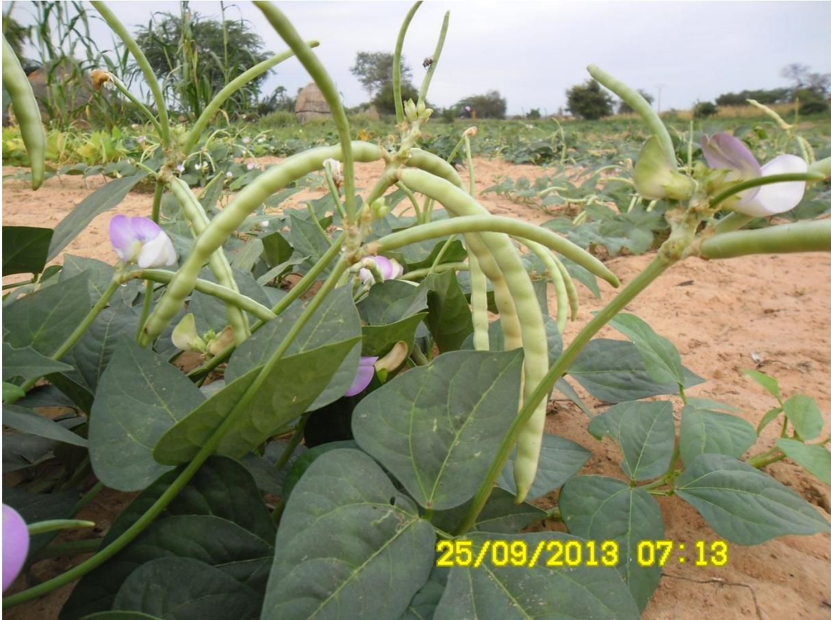
Figure 2: Plante de niébé fourrager en maturité à la station agronomique de l'INRAN

La figure suivante illustre la maturité et les caractéristiques précédemment décrites par la plante de niébé sur le terrain d'expérimentation (Variété TN256-87).