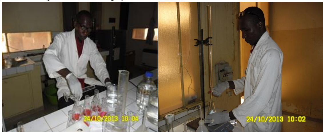
Figure 6: Analyse des échantillons au laboratoire

Le tableau III nous indique les résultats trouvés après analyse des échantillons.