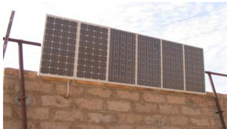
Panneaux PV pour moulin solaire, Sénégal

La visite a permis de voir qu'au-delà des services d'éclairage et d'audiovisuel individuels, les technologies d'énergies renouvelables peuvent assurer, d'autres options de fourniture de services collectifs sociaux de santé et d'éducation ainsi que le développement d'activités génératrices de revenus dont la mouture des céréales.