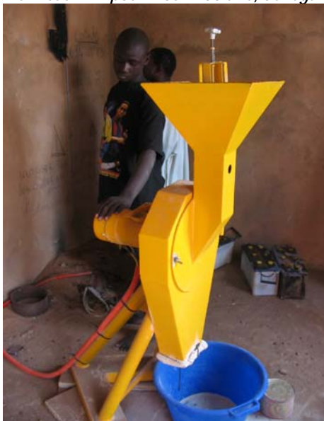
Moulin Solaire au Sénégal: Réduire la corvée des femmes