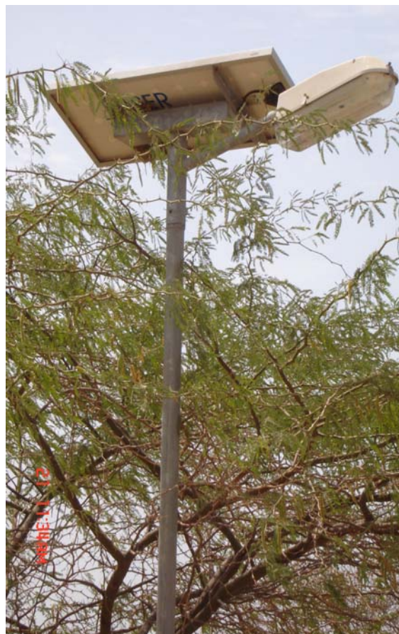
Lampadaire solaire dans l'île Mar Lod