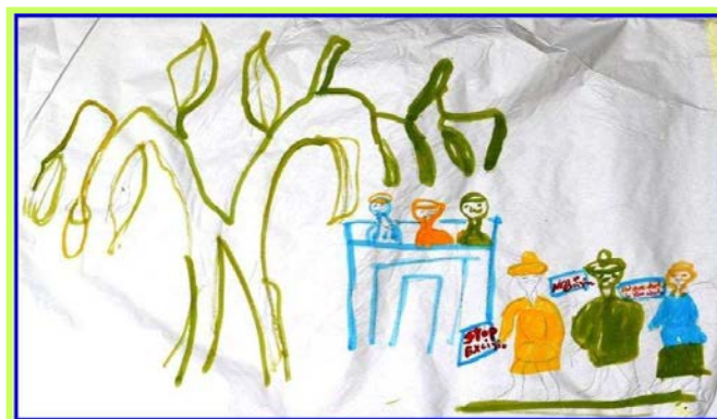
"Stop excision" - "C'est mon droit le plus absolu"

environnement et développement du Tiers-Monde