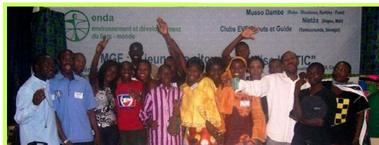
Mettre les jeunes au coeur du processus

A l'ère de la mondialisation, penser globalement l'excision, le genre, la citoyenneté, les jeunes et les TIC , c'est voir l'ensemble de l'enjeu de développement pour les communautés d'Afrique de demain, celle des jeunes d'aujourd'hui.