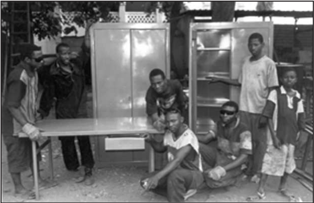
Atelier Carrefour des Jeunes (Bamako)