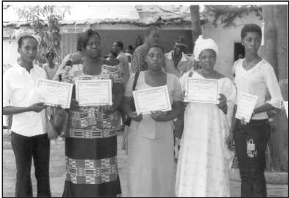
Filles en fin de formation

Enda. C'est la marque de confiance entre l'enfant et la structure.