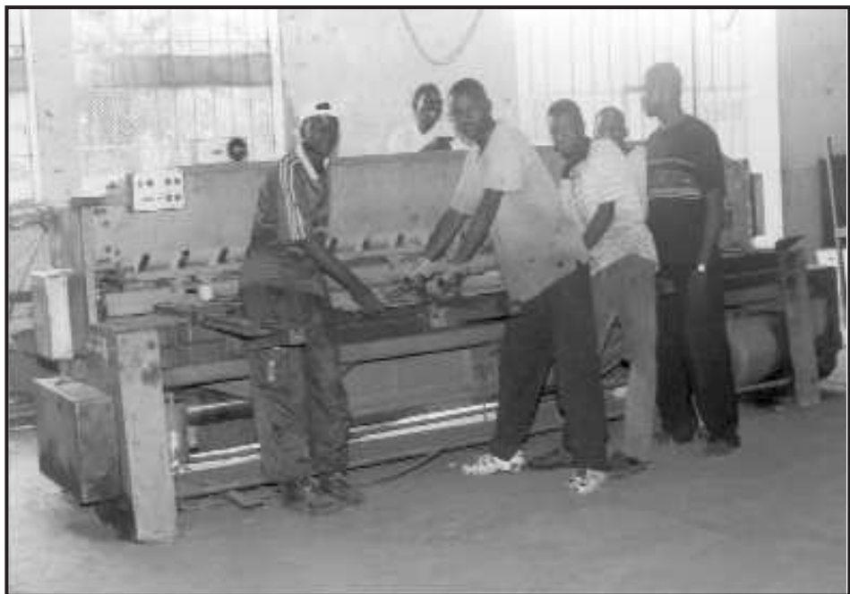
Jeunes en stage à l'ECICA

Le placement en stage de perfectionnement constitue l'un des grands axes de la formation sur le tas initiée par Enda Tiers Monde. Il consiste à la mise en stage dans les structures techniques hautement qualifiées des apprentis en fin de formation au