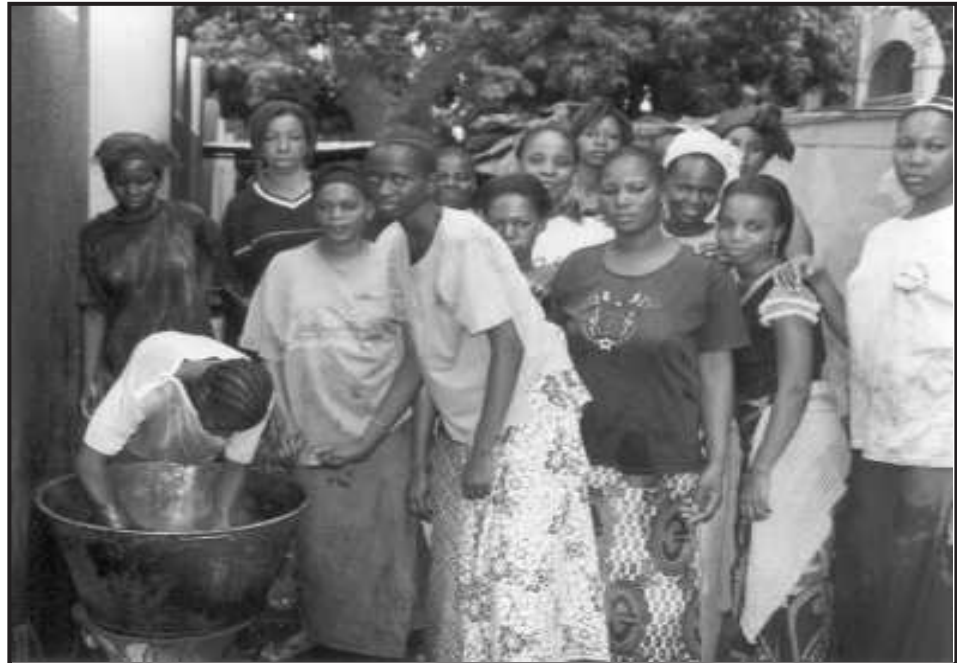
Filles en apprentissage

Sans se démarquer du développement rural, Enda, face aux graves contradictions créées par la ville, s'est engagée dans le traitement des problèmes urbains en général et particulièrement la situation des groupes