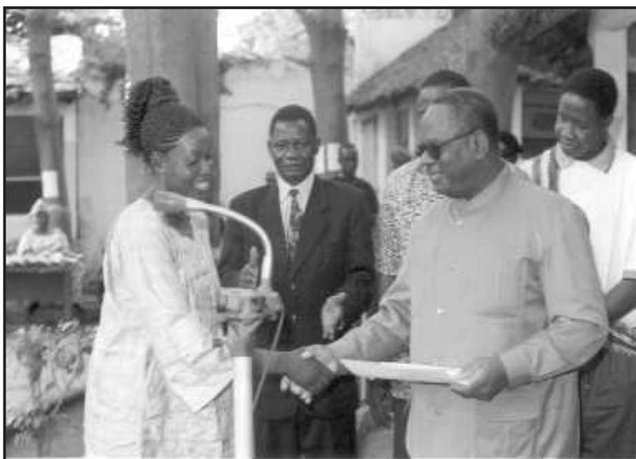
Le Président de l'Assemblée Nationale du Mali à la foire exposition des produits de jeunes en formation

Les réflexions doivent être conduites dans le sens de l'homologation des certificats délivrés, cela