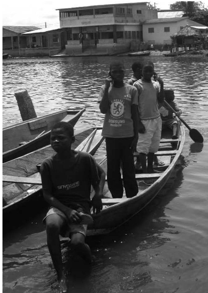
Difficulté d'obtenir le réseau pour communiquer par téléphone (au lac, Bénin)

"Nous ne pouvons pas faire du porte-à-porte ni de bouche à oreille. Quand quelqu'un n'est pas proche de nous nous utili-