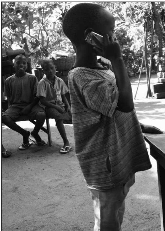
Enfant avec téléphone (Bénin)

Le téléphone portable est la TIC le plus utilisé au sein de nombreux groupes