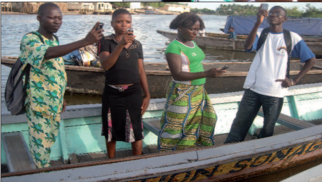
Recherche de "réseau" au lac (Bénin)