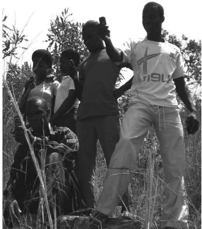
Recherche du réseau au sommet (Togo)