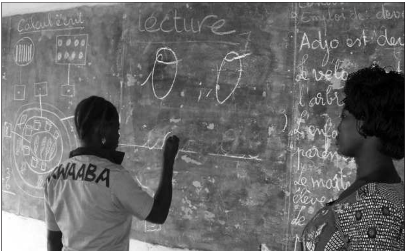
Monitrice en classe d'alphabétisation

La formation des EJT à l'acquisition de capacités à lire et écrire de leurs amis EJT, s'inscrit dans le cadre de l'approche participative en matière d'éducation.