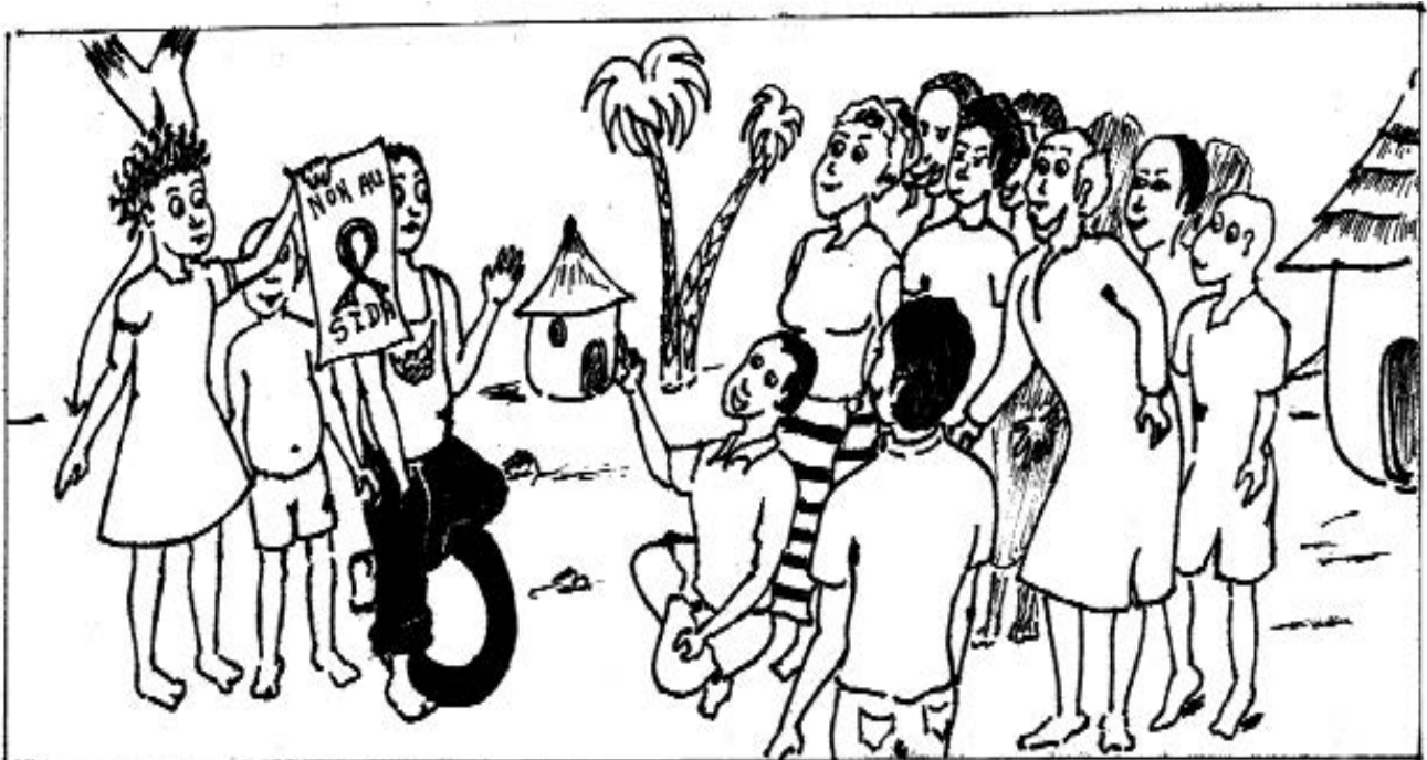
Sensibilisation pour amener les enfants dans les classes d'alphabétisation

La mobilisation des EJT prend diverses formes de sensibilisation pouvant aller de l'approche de proximité à l'utilisation des médias.