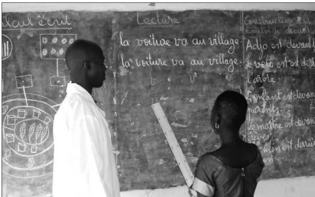
Moniteur d'Adomi en classe d'alphabétisation