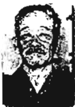
Maître Jigoro Kano.