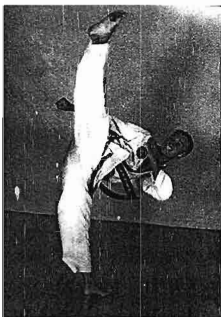
Démonstration de taekwondo

Le Taekwondo se caractérise comme un Art de combat à main nue. Mais au-delà, de l'aspect guerrier, les anciens maîtres ont trouvé un peu vain de se perfectionner dans des techniques de combat si l'individu n'en profitait pas pour son épanouissement personnel. Les techniques de combat ont servi dès lors comme support et comme moyen de perfectionnement. Le but n'était plus alors la recherche absolue de l'efficacité mais le désir de vivre mieux en harmonie avec la nature et la société.