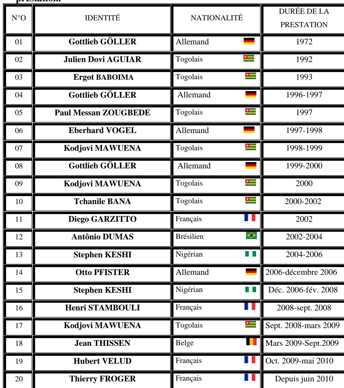
Tableau 03 : Tableau synoptique des sélectionneurs et la durée de prestation.

Source : « http://fr.wikipedia.org/wiki/%C3%89quipe_du_Togo_de_football ».