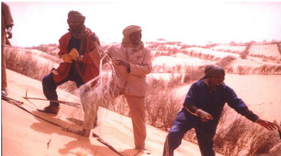
Photo 2 : Volontaires du SNP sur un site de fixation de dune à Goudoumaria

600 hectares de dunes ont été traités à l'aide du leptadenia pyrotechnica (kalumbo) et des branches d'hyphaéné thébaïca(Gomba).Ce traitement avait pour but de protéger les cuvettes(agricoles et pastorales) ainsi que la Route de l' Unité.