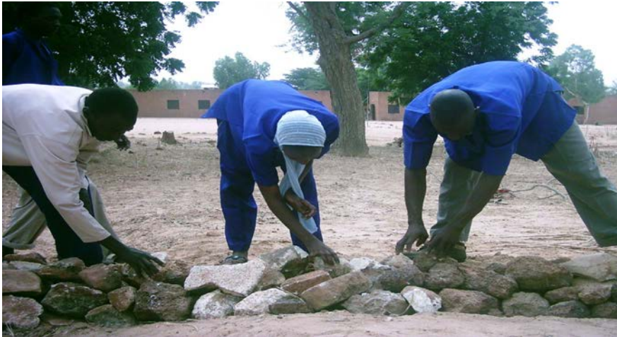
Photo 3 : Les volontaires du SNP sur un site de traitement biologique

550 hectares de terre dégradée (glacis, kori) ont été traités (kossey route Torodi) avec la réalisation de plusieurs milliers d'ouvrages anti-érosifs (demi-lunes, tranchés, barrages en pierres sèches et en gravions, cordon de pierre).